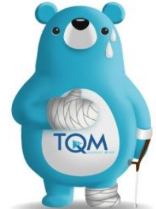
ประกันอุบัติเหตุ กันไว้ดีกว่าแก้