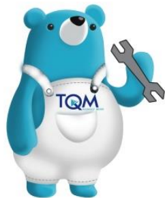
บริการซ่อมอู่ ได้มาตรฐาน เชื้อคือได้