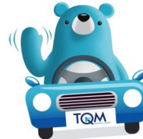
ประกันรถยนต์ อบอุ่นใจ ไว้ใจได้