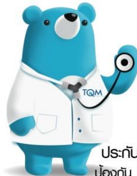
ประกันสุขภาพ ป้องกัน ครอบคลุม