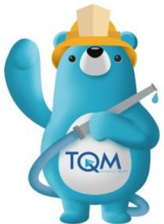
ประกันอัคคีภัย ปลอดภัยไว้ใจได้